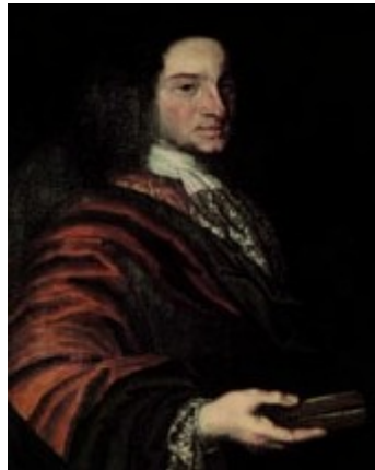
Christopher Polhem (1661-1751)

zusammen. Nachdem er das Weihnachtsfest mit Erik Benzelius verbracht hatte, wurde er im Januar 1716 von Christopher Polhem und seiner Familie in Stjarnsund aufgenommen.