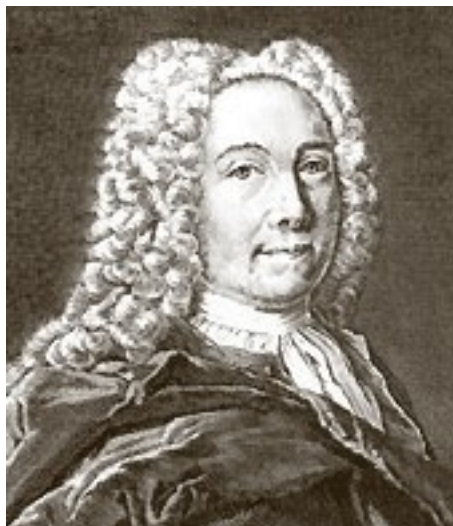
Swedenborg im Jahre 1733

Im Juli 1735, ungefähr ein Jahr nach Emanuels Heimkehr von seiner dritten großen Auslandsreise, starb sein Vater. Dank der günstigen Beurteilung der Philosophischen und Mineralogischen Werke Swedenborgs in der deutschen Presse war er nun in Europa wohlbekannt. Sein Vater Jesper Svedberg war 33 Jahre lang Bischof von Skara und 30 Jahre lang Professor der Theologie gewesen. Er wurde von vielen bewundert und geliebt, obgleich er sich durch seine Predigten und seine Amtsführung auch viele Feinde gemacht hatte, weil er kein Blatt vor den Mund zu nehmen pflegte. Die Beisetzung in Varnhem in der Provinz Westrogothia nahe Skara fand im Januar 1736 statt. Im Kloster zu Varnhem wurde er zur letzten Ruhe gebettet.