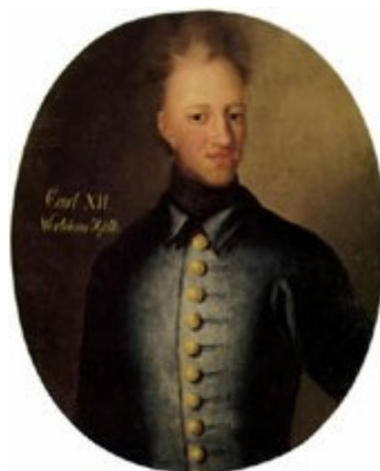
Karl XII (1682-1718)

Der große Erfinder war sehr zufrieden mit dem neuen Journal, das in jeder Ausgabe eine seiner Erfindungen vorstellte, wie auch mit seinem neuen Assistenten. Er bezog Emanuel in seine Arbeit ein und bot ihm bald die Hand seiner ältesten Tochter Maria an. Emanuel gab aber ihrer jüngeren Schwester Emerentia den Vorzug und wandte, wie er sich ausdrückte, "verschiedene Ränkespiele" an, um Maria nicht heiraten zu müssen und doch bei allen beliebt zu bleiben. Emerentia aber wies ihn ab, weil sie einen anderen heiraten wollte. Sie war hochbegabt und ebenso tüchtig wie hübsch. Nach dem Tode ihres Vaters übernahm sie die Verwaltung der Schmiede in Stjarnsund. Emanuel war tief enttäuscht, setzte aber seine Arbeit für Polhem fort.