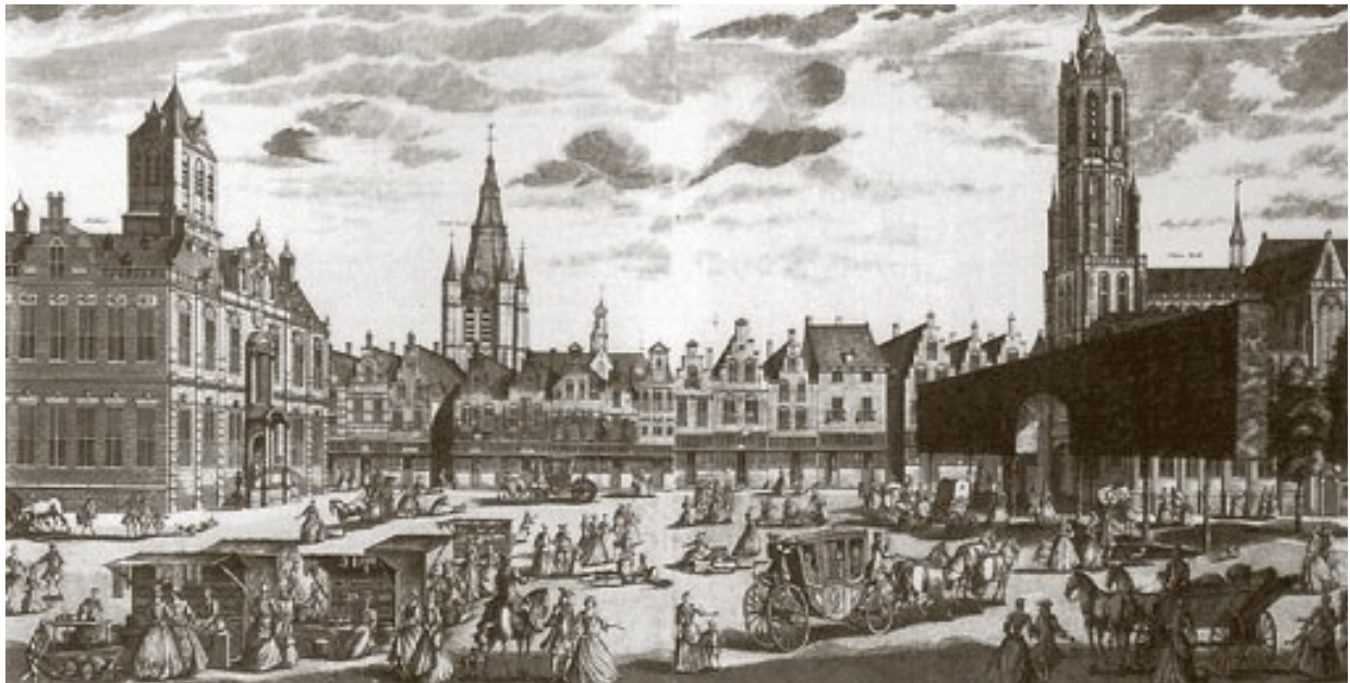
In Delft erlebte Swedenborg seine erste Christusvision

In der darauffolgenden Nacht überkam ihn ein solches Zittern, daß er buchstäblich aus dem Bett auf den Fußboden fiel. Dort erfuhr er bei klarem Wachbewußtsein eine Christusvision. Er fand sich geborgen im Schoße Jesu und fühlte, daß er einen göttlichen Auftrag für ein besonderes Werk erhielt. Nach diesem Erlebnis überfielen ihn heftige Zweifel, ob er einer solchen Heimsuchung überhaupt würdig sei, und diese Zweifel wurden wiederum abgelöst durch die Furcht, sich am Herrn zu versündigen, wenn er ihm nicht glaubte. Schließlich fühlte er sich beschenkt mit tröstender Gewißheit und fiel in einen friedvollen Schlaf. 19 Bevor es Morgen wurde, träumte er, sein Vater käme zu ihm und bände ihm wortlos die Manschettenbänder zu. Als Swedenborg erwachte, schrieb er alle Ereignisse der Nacht nieder, einschließlich des letzten Traumes, wobei er notierte, die Manschetten seien ein Symbol des Laienstandes. Daß sein Vater ihm die Bänder daran geschnürt habe, sei ihm ein Zeichen, daß er endlich einverstanden sei mit seinem Stand außerhalb des Klerus. Der Traum signalisierte wohl auch noch eine andere Veränderung in ihm: Er hatte gelernt, seinen Vater als ebenbürtig und nicht mehr als Autorität zu betrachten. 20