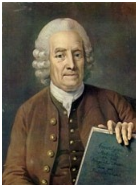
Swedenborg als Verfasser der »Enthüllten Offenbarung«

Nachdem Swedenborg 1764 das Werk "Die Göttliche Vorsehung" herausgebracht hatte, fühlte er sich offensichtlich frei, ja verpflichtet, wieder zur Auslegung der Apokalypse zurückzukehren. Diese Freiheit zeigt sich in der zielbewußten und effizienten Art, wie er nun an dieses Buch herangeht. Der Auftrag ist höchstwahrscheinlich der, den er in seinem Werk "Die eheliche Liebe" erwähnt, wo er am Ende eines nicht datierten Visionsberichts wörtlich sagt: "Dann hörte ich eine Stimme aus dem Himmel, die zu mir sprach: 'Geh in dein Zimmer, schließe die Tür und widme dich dem angefangenen Werk über die Apokalypse, und bringe es in zwei Jahren zuende.'" 27 Tatsächlich publizierte er zwei Jahre nach der "Göttlichen Vorsehung" nämlich 1766, unter leicht abgeändertem Titel das Werk "Die Enthüllte Offenbarung".