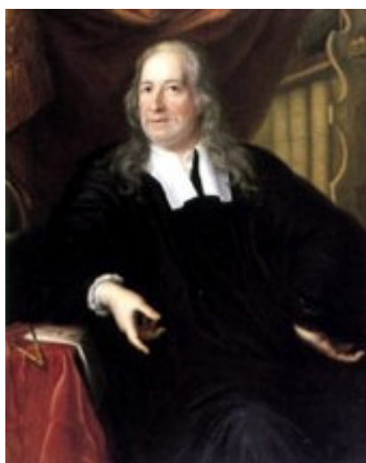
Olof Rudbeck (1630-1702)