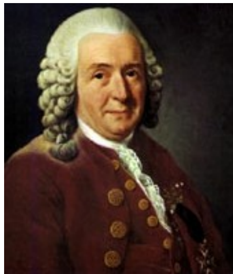
Carl von Linné (1707-1778)

Swedenborg bewegte sich in dieser Periode seines Lebens in den höchsten Kreisen der schwedischen Gesellschaft. Regelmäßig nahm er an den Sitzungen des Reichstags teil; häufig war er bei Hofe. Zu seinen Freunden gehörten der damalige Ministerpräsident, Graf Höpken, ebenso wie der Präsident des Adelshauses, Graf Tessin. 17