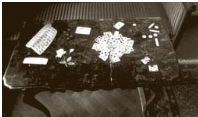
Tisch mit Marmor-Intarsien

kam, die er schon in der frühen Kindheit entwickelt hatte. Zuweilen erlebte er etwas wie ein "Zeichen", das er als Bestätigung dafür betrachtete, daß er bei seiner Arbeit die richtige Spur verfolgte. "Signum habeo - ich habe ein Zeichen ... wie ein heiteres Licht oder ein bestätigender Blitz ... Woher das kommt, weiß ich nicht, es ist wie eine gewisse geheime Strahlung, die den heiligen Tempel des Gehirns durchfährt". 14 Die ersten Berichte über diese bestätigenden Blitze erscheinen in den Tagebucheintragungen während dieses Aufenthalts in Amsterdam.