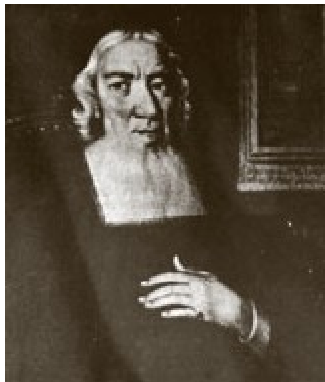
Jesper Swedberg (1653-1735)